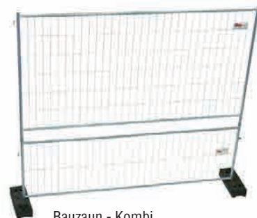
Bauzaun - Kombi